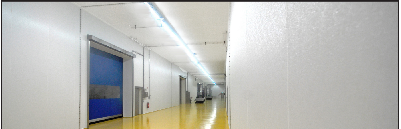
Installationen im Flurbereich einer Käserei