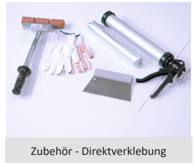
Zubehör - Direktverklebung

*Beachten Sie dazu unsere Datenblätter und Montagehinweise